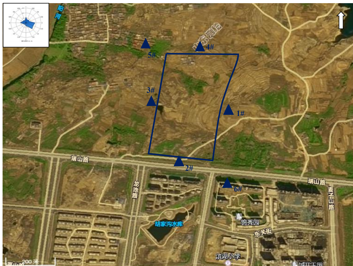
图 3.7-1 噪声、电磁环境监测布点图